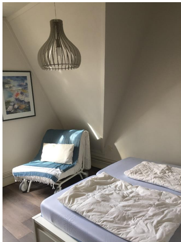
De tweede masterbedroom met 2persoonsbed en slaapfauteuil

Voor meer foto's: https://www.instagram.com/cocoonhuisjes/