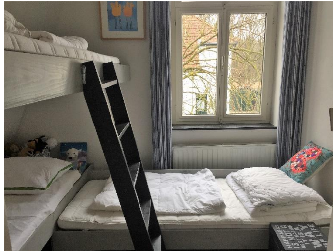
De kinderkamer met 3 bedden

De masterbedroom is onveranderd, met het 2persoons van 2 Auping matrassen van 90 x 200.